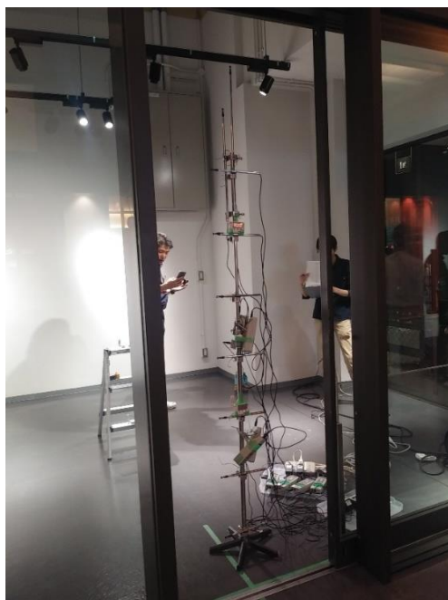
図1 冷気流出性状の測定状況

図1は、実在の路面店の扉において風速分布および温度分布を測定した状況です。この測定は、夏季に室内を冷房した状態で行って行っていたので、開口の下部から冷気が流出し、上部から暑い外気が流入していました。