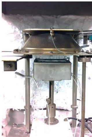
図1 コーンカロリメータ装置

放射率が既知の鉄板を加熱した時の表面温度を赤外線放射温度計により測定し、熱収支から対流熱伝達率を求めた結果を図3に示します。この結果を用いると、コーンカロリメータ試験により材料の着火温度や熱慣性等の着火特性を直接測定することができるようになります。二層ゾーンモデルなどの火災シミュレーション技術と併用すれば、実火災における材料の燃焼挙動の予測が可能となります。